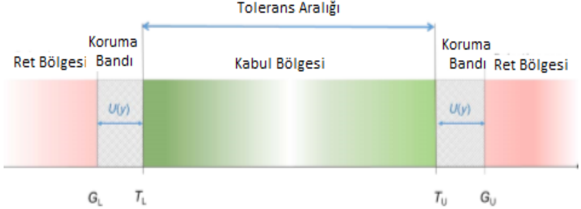
Şekil 2-Alt ve Üst Limite Dayanan Kabul ve Ret Bölgesi (Yanlış Ret)